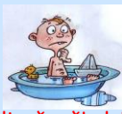
Plivač u školskoj reprezentaciji